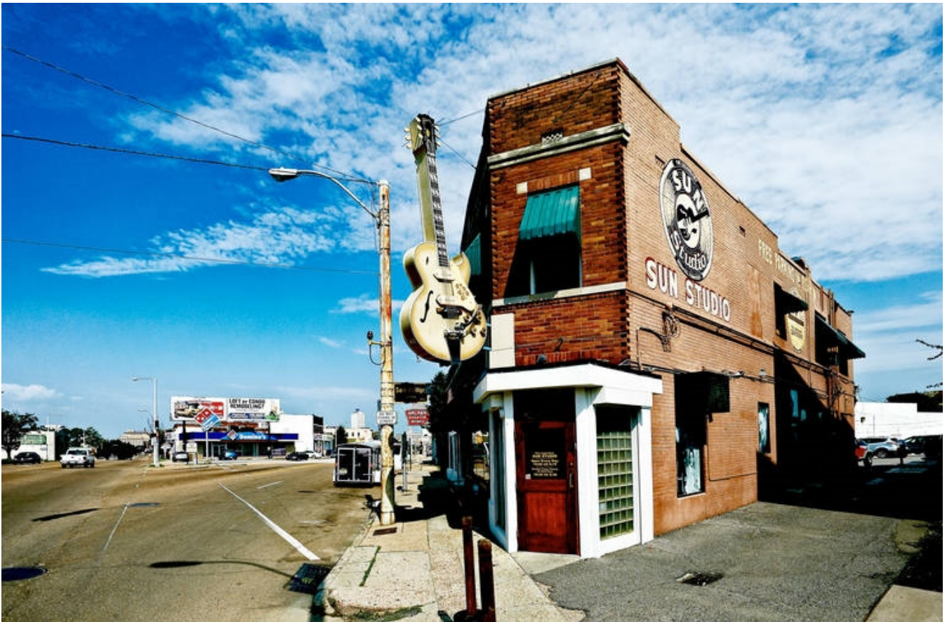
Sun Studio, Memphis

indretningen sine steder er noget 70'er-kitschet, men det er en del af oplevelsen. Junglerummet, for eksempel, har grønt gulvtæppe, masser af planter og et sofabord, der er som taget ud af Amazonregnskoven.