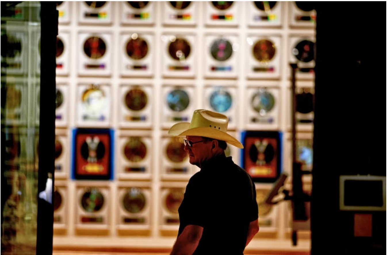
Country Music Hall of Fame, Nashville