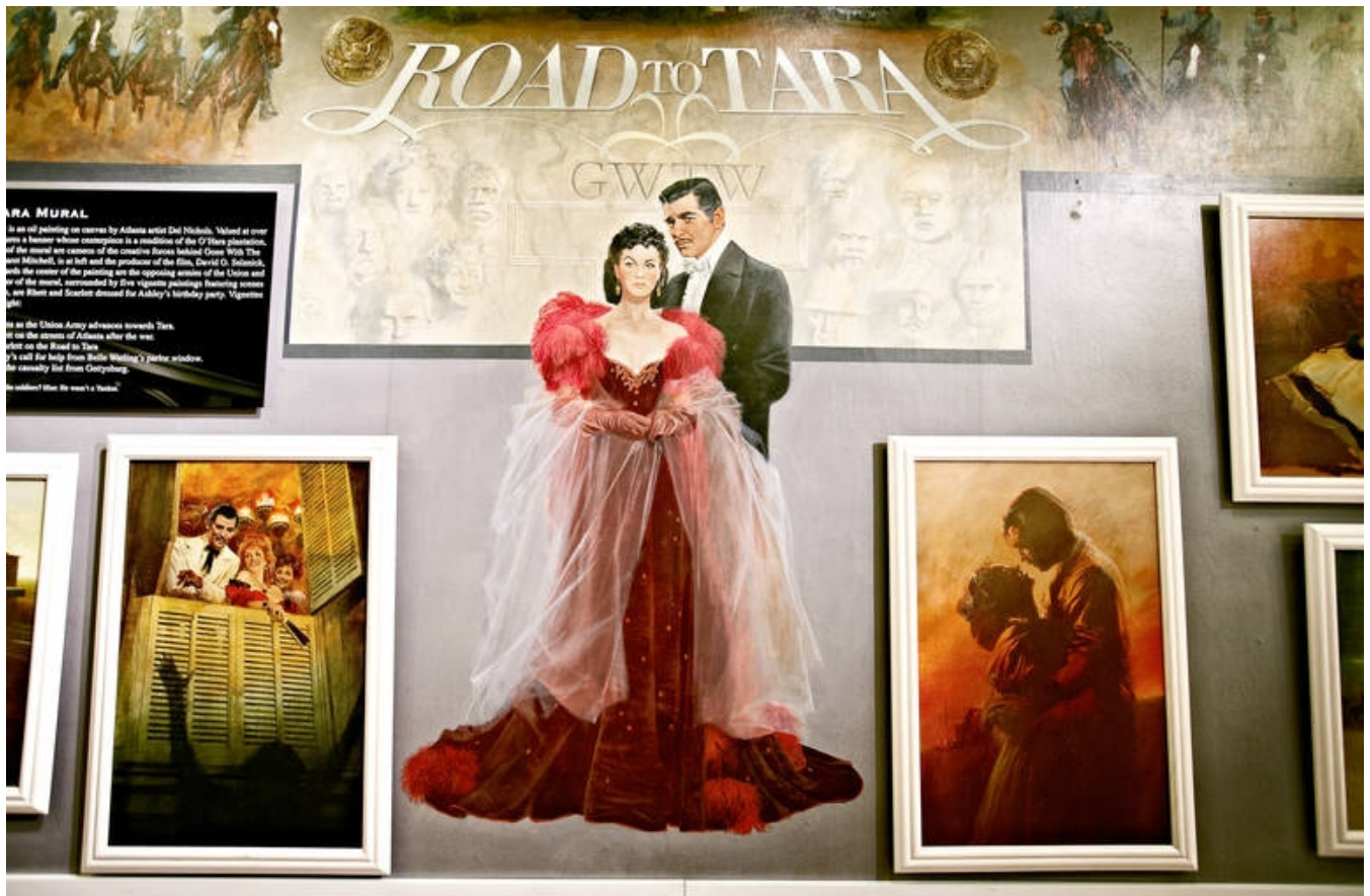
Road to Tara-museet, Jonesboro