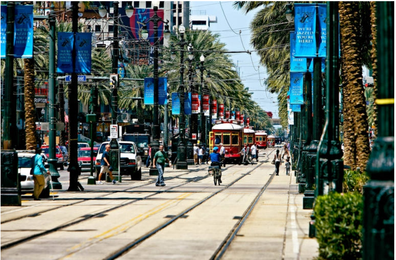
Sporvogn, New Orleans

Midt på dagen kører vi mod Vicksburg, som vi når sidst på eftermiddagen. Vi tjekker ind på vores hotel, og aftenen er til fri disposition.