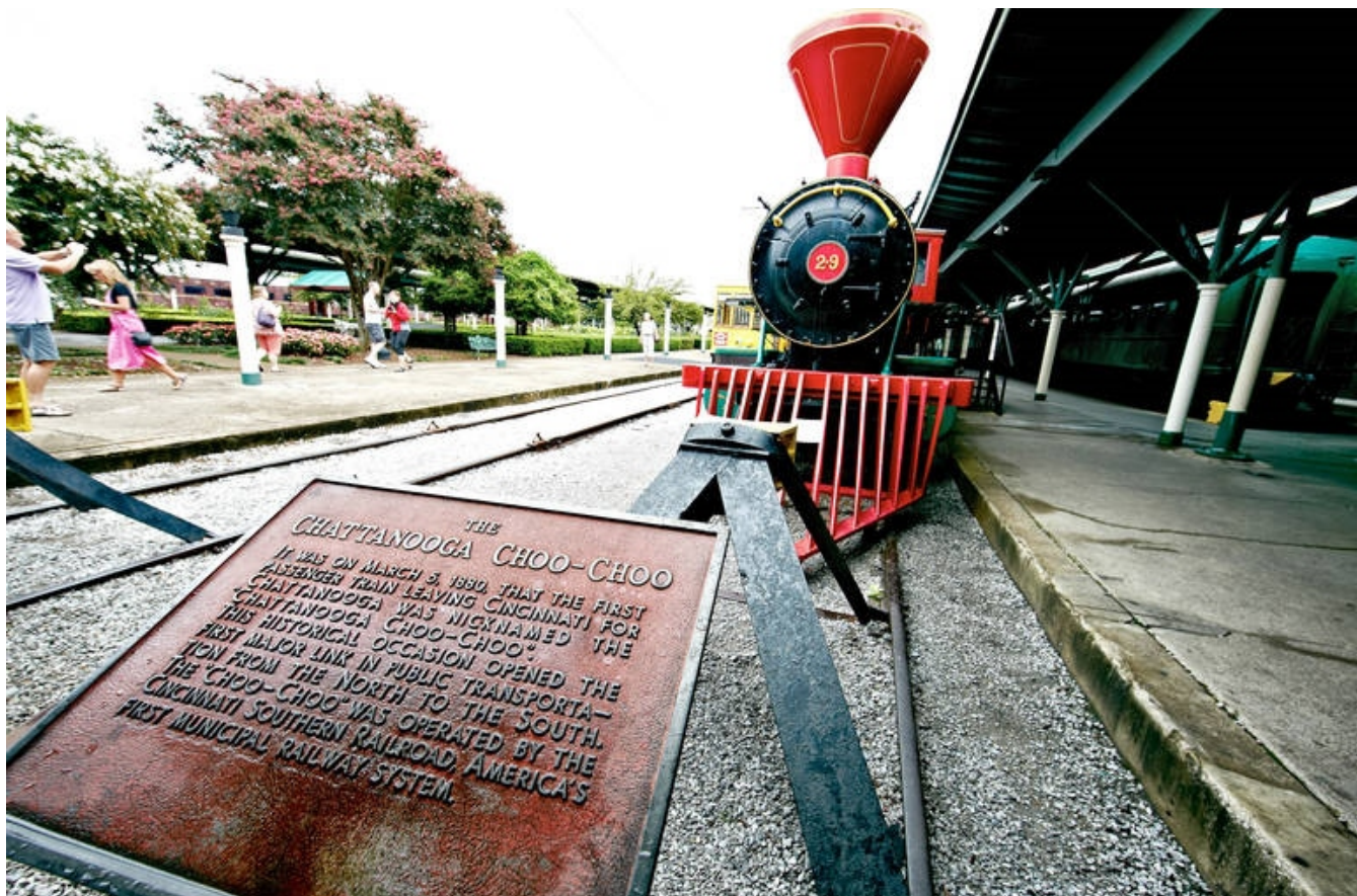
Chattanooga Station, Tennessee

forbi Jonesboro, hvor vi besøger byens gamle jernbanestation. Her er indrettet et museum for alt, hvad der har med Borte med Blæsten at gøre – romanen på forskellige sprog, kopier af skuespillernes dragter fra filmen, Margaret Mitchells porcelæn