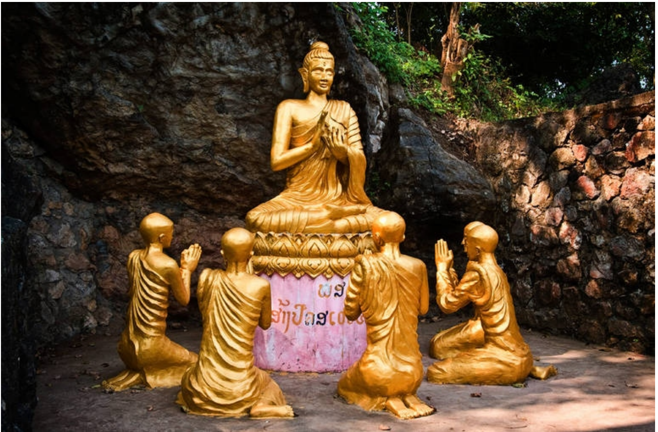
Flere tusinder Buddha-figurer er samlet i Pak Ou-grotterne

til en autentisk snarere end luksuriøs oplevelse. Vi glider stille gennem frodig laotisk jungle og besøger undervejs flere landsbyer, beboet af forskellige lokale bjergstammer.