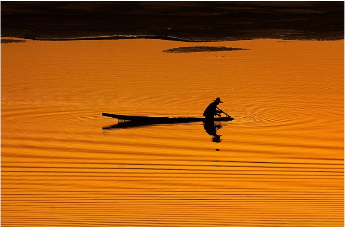
Stille fiskeri på Mekong