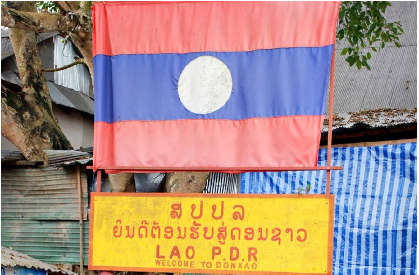
Grænsen ved Den Gyldne Trekant