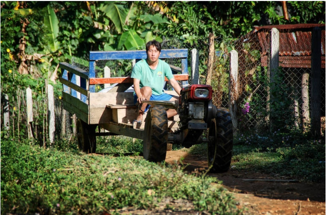
Lokalt liv i Laos