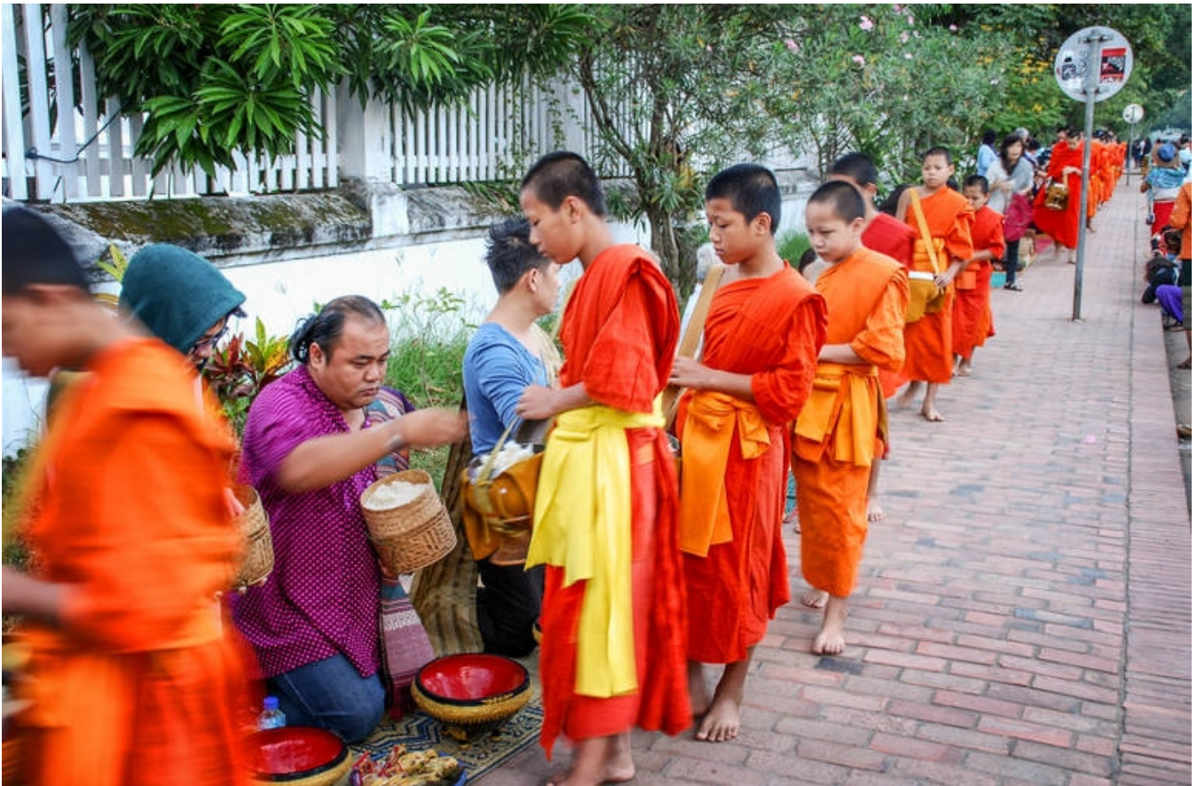
400-500 munke i optog gennem Luang Prabang