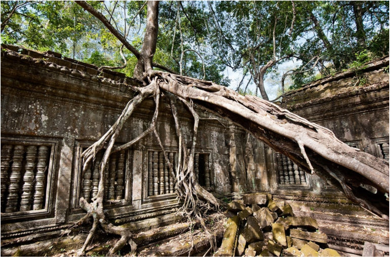
Det tilgroede Beng Mealea-tempel